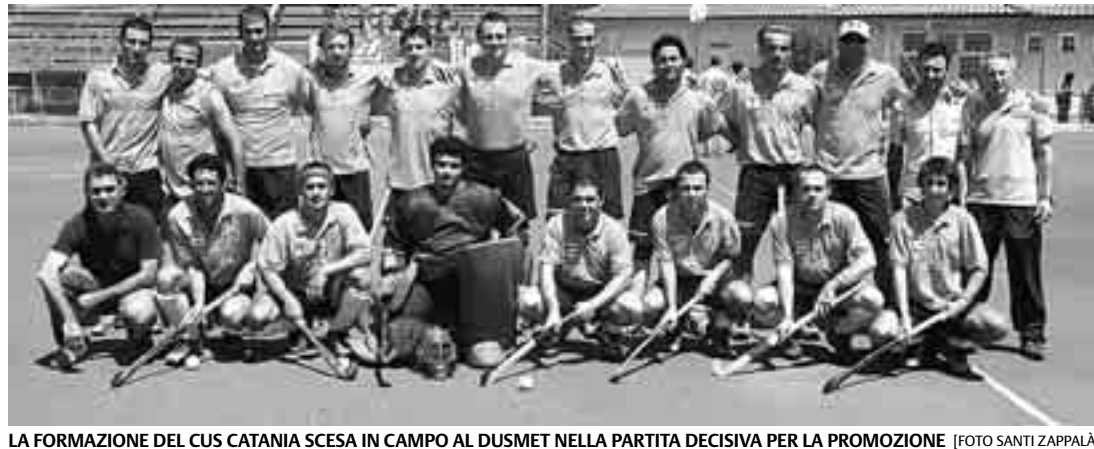
LA FORMAZIONE DEL CUS CATANIA SCESA IN CAMPO AL DUSMET NELLA PARTITA DECISIVA PER LA PROMOZIONE

Finali dei play off: la squadra di Sapienza perde in casa per 3-2 ma capitalizza il successo dell'andata, l'undici di Barrera la spunta 2-1 sull'Eur