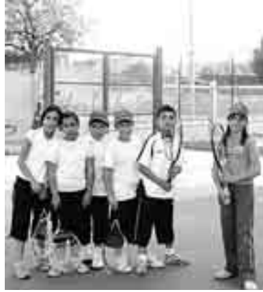
UN GRUPPO DELLA SAT DEL TC TRECASTAGNI